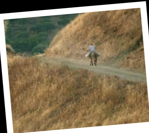
Een boer rijdt op zijn ezel tussen de graanvelden van Sicilië. Een beeld dat al decennialang onveranderd is.

Sicilië, de romantische vakantiebestemming met de verrukkelijke keuken... Maar meer dan 600 jaar achterstelling en uitbuiting hebben ook héél andere sporen achtergelaten op dit idyllische eiland. De schrijnende armoede die hiervan het gevolg was, leidde in de jaren 20 van de vorige eeuw tot de opkomst van... de maffia.