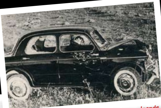
De moord op dokter Navarra. In de daarop volgende vete schoten maffiosi elkaar op pleinen en straten neer, terwijl er mensen liepen te wandelen.