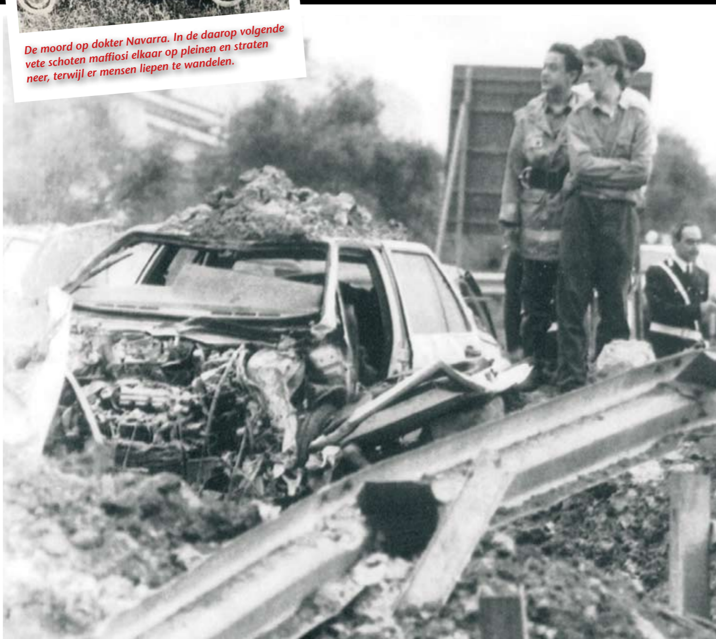
De moord op rechter Giovanni Falcone, zijn vrouw Francesca Morvillo en zijn lijfwachten. Falcone heeft ooit gezegd: 'De maffia vergeet niet en de maffia vergeeft niet.'